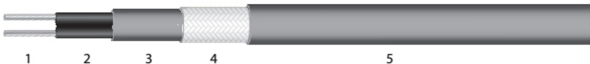
Рис. 1в, Исполнение для таяния снега.