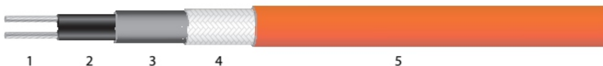
Рис. 1б. Исполнение для утепления труб с питьевой водой, внутри трубы.